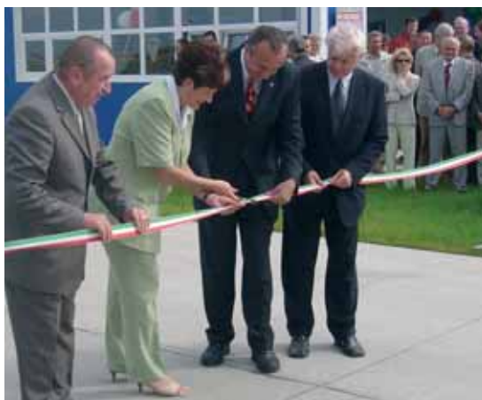
■ Ünnepélyes átadás Szolnokon

Ahol a gazdaság ütemesen fejlődik, ott a testre szabott, modern hulladékgazdálkodási és újrahasznosítási rendszerek iránt nagy érdeklődés mutatkozik. A szolnoki régió így újrahasznosításon alapuló hulladékgazdálkodási rendszer megépítésére írt ki pályázatot, melynek nyertese a REMON-