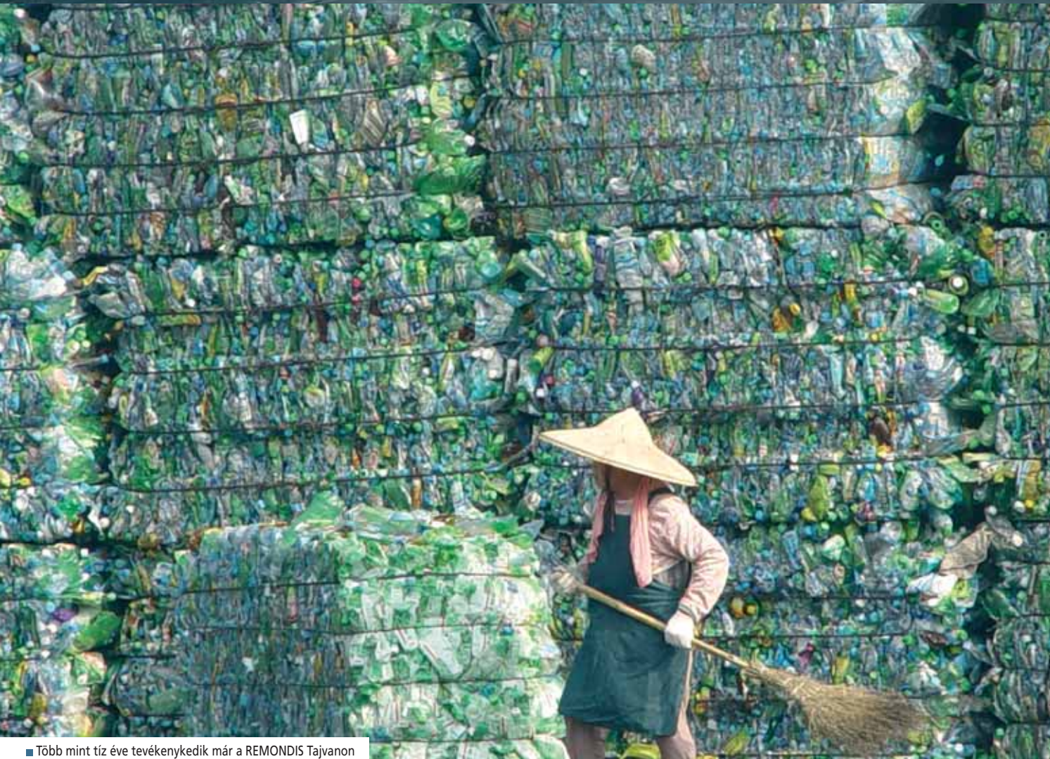
■ Több mint tíz éve tevékenykedik már a REMONDIS Tajvanon