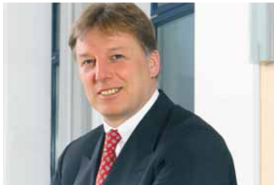
■ Egbert Tölle