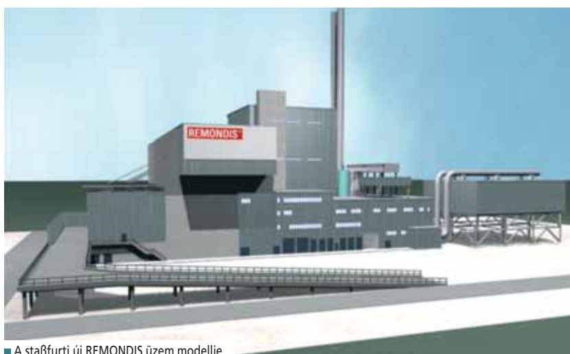
■ A staßfurti új REMONDIS üzem modellje

Eichhorn: Természetesen, méghozzá két irányból: Nem csupán a színvonalas energia-ellátottságból, hanem a tartós árstabilitásból is profitálunk.